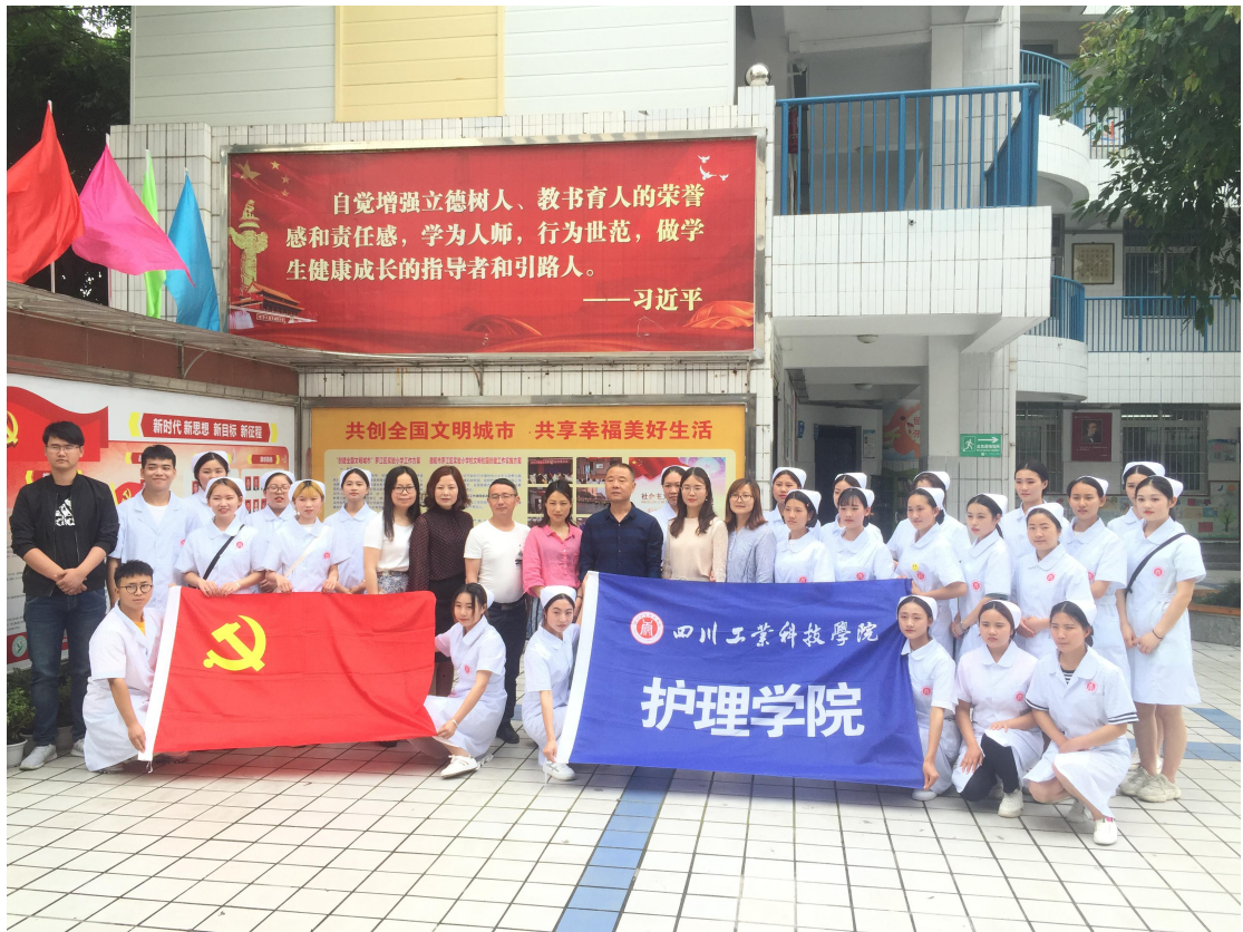
5月23日中午，护理学院组织开展“回眸七十年 奋进新时代”主题党日活动。