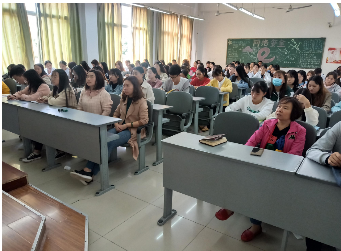
10月24日下午，护理学院团总支成立第二课堂成绩管理小组，安排部署到梦空间活动管理及二课积分认定相关工作。